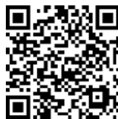
Esempio di tag

Consigliere delegata Informatica e Comunicazione