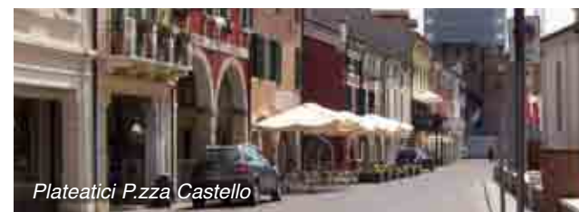
Plateatici P.zza Castello