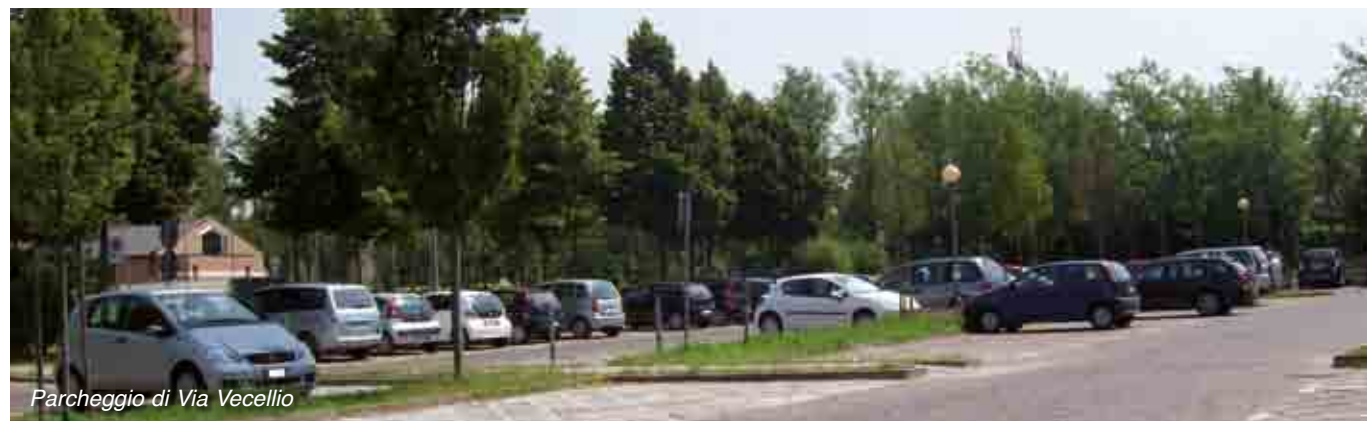
Parcheggio di Via Vecellio