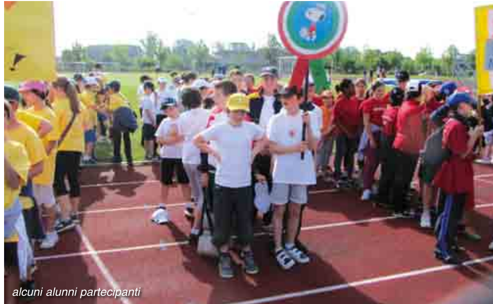
alcuni alunni partecipanti

Penso si sia tutti d'accordo nell'affermare che lo sport debba trasmettere valori sociali, morali, educativi e salutistici. Paradossalmente in questi anni viviamo con sconcerto il tradimento dei suoi valori più nobili, la sua strumentalizzazione a fini economici e politici, la negazione di quel "Citius, Altius, Fortius" principio fondamentale delle prime Olimpiadi. È con queste convinzioni che, ormai da quattro anni, il progetto PiùSport@Scuola muove i suoi passi tra i banchi della Scuola Primaria del Comune di Noale. Quattro anni in cui le Società Sportive del territorio hanno offerto, gratuitamente, i loro servizi per portare nella scuola la formula vincente che garantisca a tutti la pari opportunità di successo: la formula polivalente e polisportiva. Attraverso questa formula di una pratica diversificata, gli istruttori delle società sportive coinvolte, con efficacia hanno aiutato i bambini a proporre il meglio del loro repertorio, aiutandoli a capire come molte capacità motorie, fisiche, tecniche e